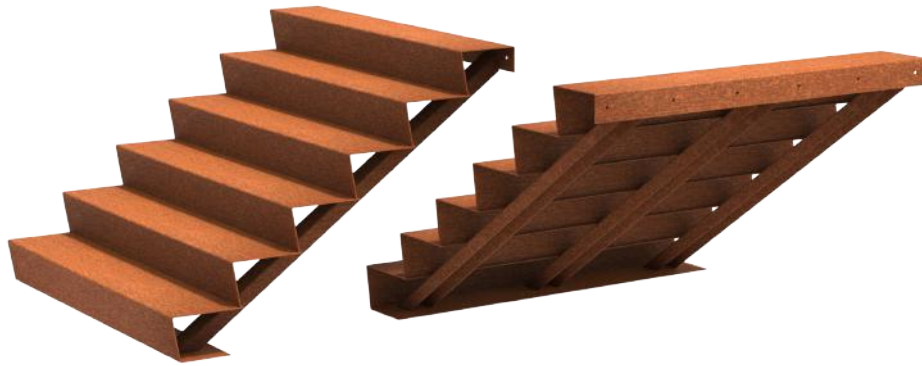
Corten Stahl Treppe (CST)