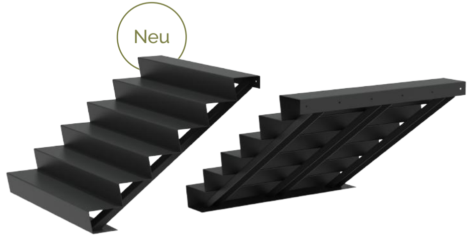
Aluminium Treppe (AST)